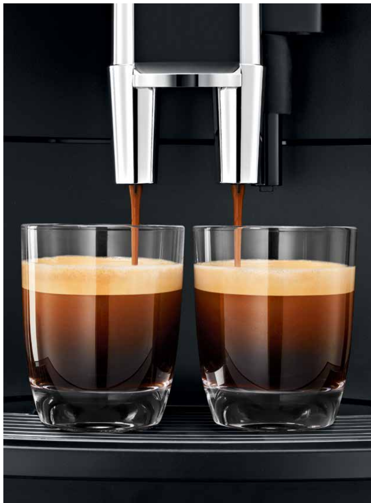
WE6 Les classiques du café au travail