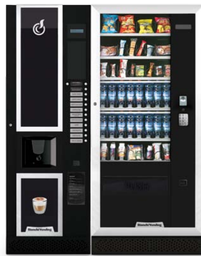
LEI600 + ARIA L MASTER